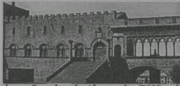
Palazzo Papale sala Alessandro IV Viterbo