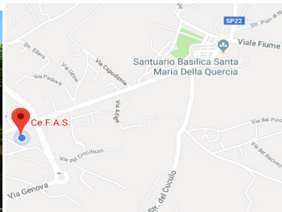
Sede operativa Viale Trieste 127, Viterbo

Ente accreditato della Regione Lazio ai sensi della Direttiva n. 968/2007 per la formazione continua, superiore e per le attività di orientamento.